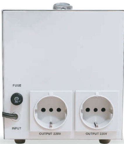
1- 2 KVA